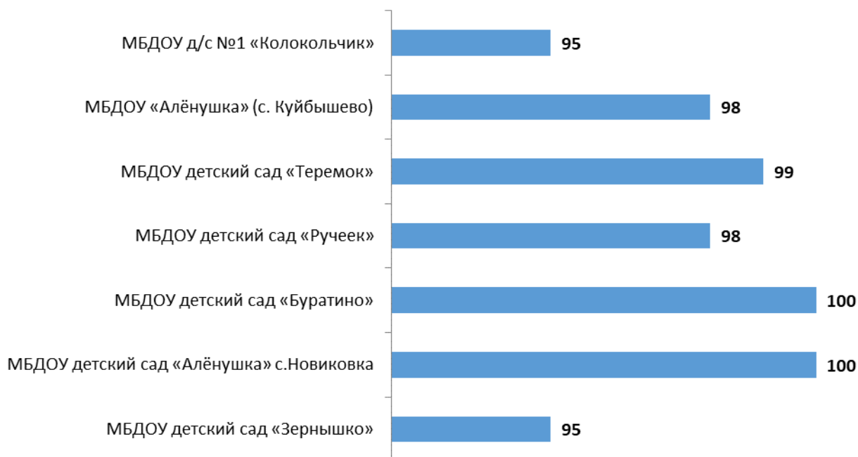
Рисунок 3.1 – Интегральные показатели, характеризующие открытость и доступность информации об образовательных организациях Куйбышевского района Ростовской области, баллы

Анализ интегральных показателей, характеризующих открытость и доступность информации об образовательных организациях Куйбышевского района Ростовской области, показывает, что зафиксированные оценки параметров находятся на достаточно высоком уровне: