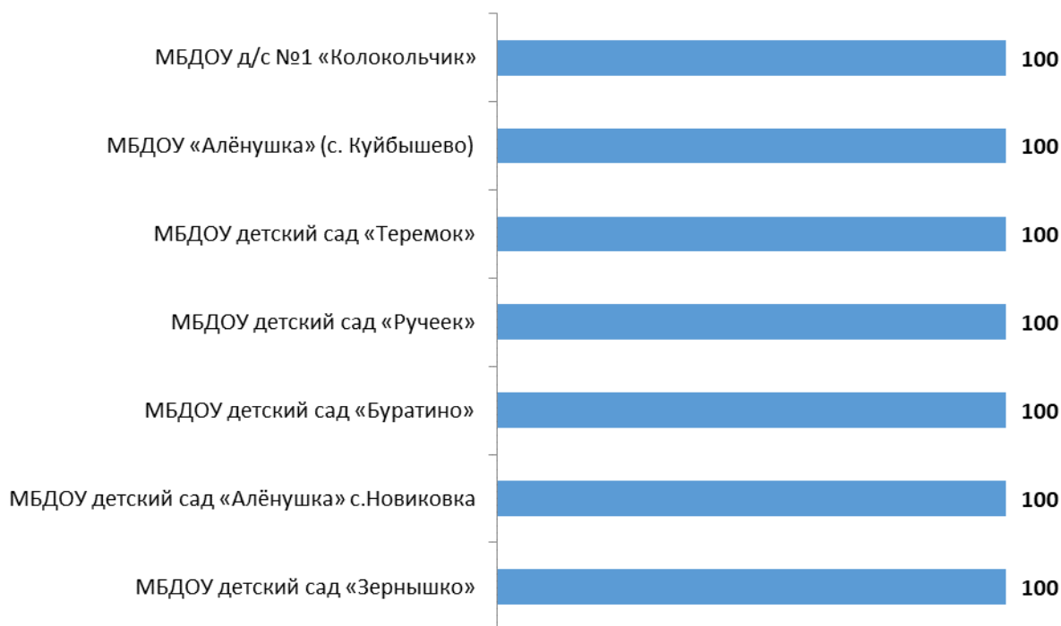
Рисунок 6.1 – Интегральные показатели восприятия опрошенными получателями образовательных услуг доброжелательности и вежливости работников образовательных организаций Куйбышевского района Ростовской области, баллы

Анализ интегральных показателей образовательных организаций Куйбышевского района Ростовской области показывает, что в отношении доброжелательности и вежливости работников зафиксированные оценки параметров находятся на высоком уровне: