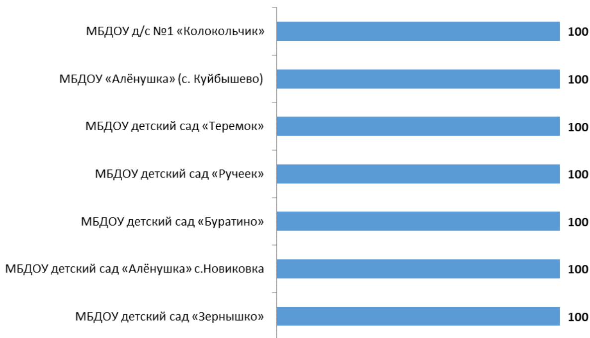
Рисунок 4.1 – Интегральные показатели, характеризующие комфортность условий осуществления образовательной деятельности в образовательных организациях Куйбышевского района Ростовской области, баллы

Анализ интегральных показателей образовательных организаций Куйбышевского района Ростовской области показывает, что в отношении комфортности условий осуществления образовательной деятельности зафиксированные оценки параметров находятся на высоком уровне: