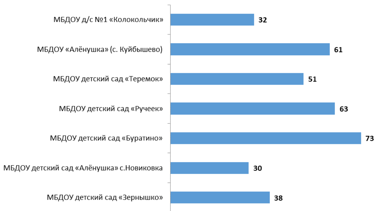
Рисунок 5.1 – Интегральные показатели, характеризующие доступность образовательных услуг для инвалидов в образовательных организациях Куйбышевского района Ростовской области, баллы

Анализ интегральных показателей образовательных организаций Куйбышевского района Ростовской области показывает, что в отношении доступности образовательных услуг для инвалидов оценки параметров демонстрируют значительный разброс: