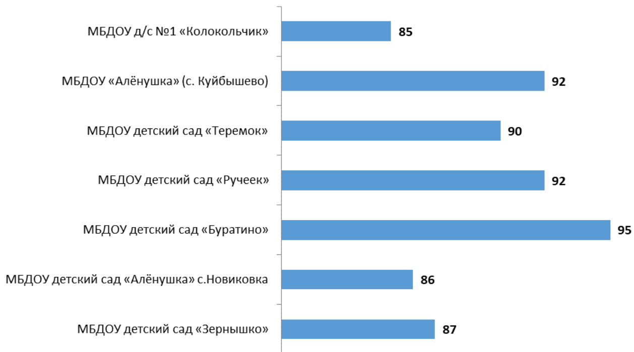
Рисунок 8.1 – Показатели оценки качества по образовательным организациям Куйбышевского района Ростовской области, характеризующие качество условий осуществления образовательной деятельности, баллы