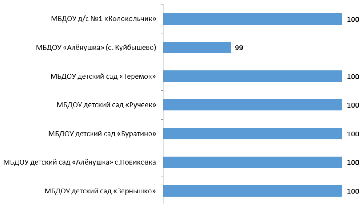
Рисунок 7.1 – Интегральные показатели, характеризующие удовлетворенность получателей услуг образовательных организаций Куйбышевского района Ростовской области условиями осуществления образовательной деятельности, баллы

Анализ интегральных показателей образовательных организаций Куйбышевского района Ростовской области показывает, что в отношении удовлетворенности условиями осуществления образовательной деятельности зафиксированные оценки параметров находятся на высоком уровне: